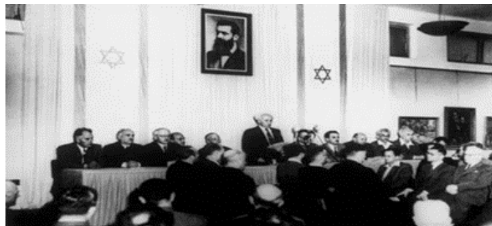
O novo Estado de Israel foi proclamado em Tel Aviv em 14 de maio de 1948.

Mais uma vez, a profecia bíblica começou a fazer sentido: